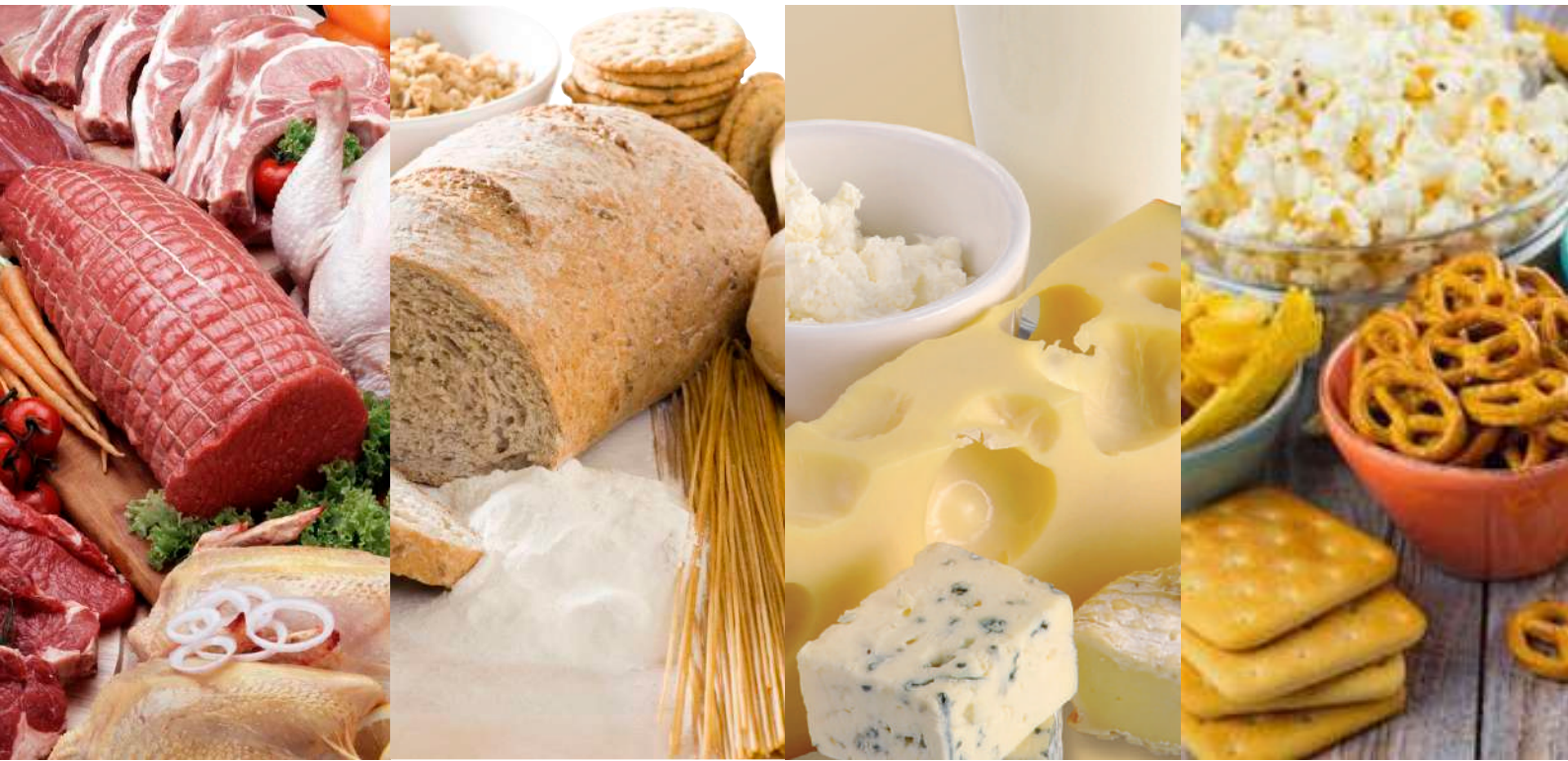
DiaGram Lactosa es un nuevo ensayo rápido y fácil de usar, basado en los principios de la cromatografía, que permite la separación y detección de lactosa en superficies, aguas y alimentos.

Test rápido para la detección de LACTOSA en superficies, aguas y alimentos